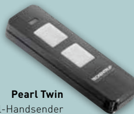
Pearl Twin 2-Befehl-Handsender

Enorm effizient: Energiesparend durch bis zu <1 Watt Verbrauch im Standby-Modus (modellabhängig)